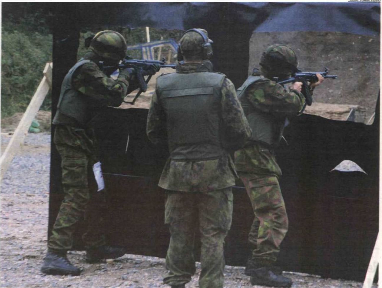
Partioammunta Stadin jotoksella.

Erillinen joukkuekilpailu, joka koostuisi joukkueen partioammunnan ja yksittäisten kilpailijoiden tulosten painotetusta summasta, sopii hyvin nykyistenkin SRA-sääntöjen alle. Toki erillinen kappale joukkue muodossa ammuttavien rastien aseenkäsittelystä ja joukkue tulosten laskentatavasta olisi paikallaan. Näillä voisi jopa käyttää suoraan puolustusvoimien turvamääräyksiä, pyörää ei tarvitse keksiä uudelleen.