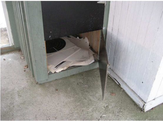
Jäsenistön käytössä olevat taulut.

Radalla saa ampua vain kaliberiltaan .22-.38 aseilla ja käytettävien panoksien pitää olla lyijyluotisia, muilla ei saa ampua, ei edes kuparipinnoitetuilla luodeilla.